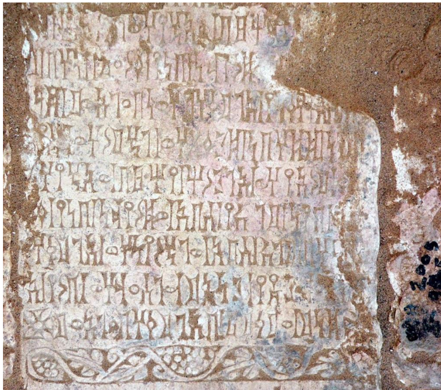
صورة (١): النقش: (AL- Badawi Maḥram Bilqīs1)